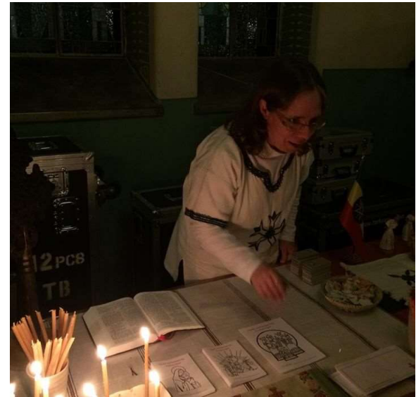
Rukousalttari Tuomasmessussa.

Tammikuussa osallistuin Ryttylässä Missioforu- miin. Keskustelut lähettäjien kanssa havahdutti- vat minut huomaamaan, että aivan liian usein ajattelen lähetystyötä vain omasta eli lähetin nä- kökulmasta. Siksi haluan rohkaista sinua kerto- maan omista ajatuksistasi ja toiveistasi, olit sitten "tavallinen lähettäjä", lähettisihteeri tai seura- kunnan tai lähetysjärjestön edustaja. Miten voi- simme parantaa yhteistyötämme?