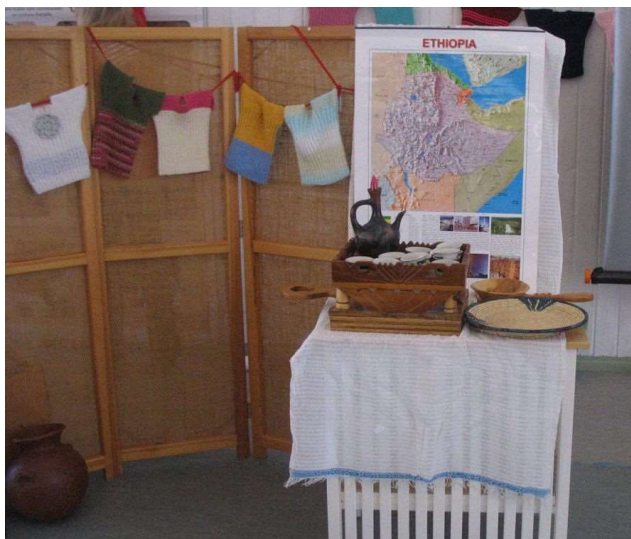
Etiopian esittelypiste Missioforumissa